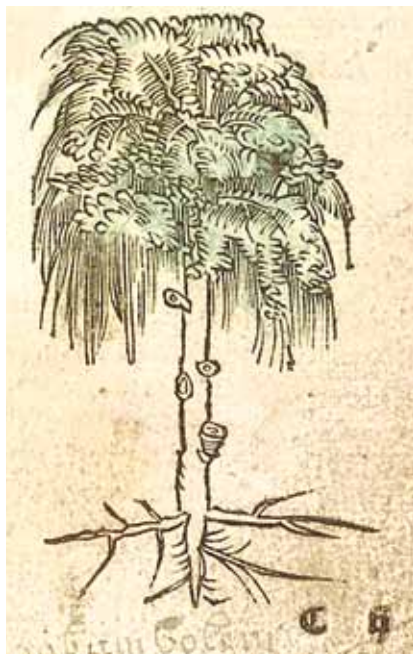
Jan Černý (žil cca 1456–1530), Knieha lékařská, kteráž slove herbář aneb zelinář , 1517. Ilustrace je v herbáři použita na dvou místech – u agaricu, který roste na jedli či (mo)dřínu, a u borovice. Je zřejmé, že vyobrazený strom nese znaky většiny běžných jehličnanů, a podobně jako u Altdorfera je vyobrazen spíše „universální jehličnan“.