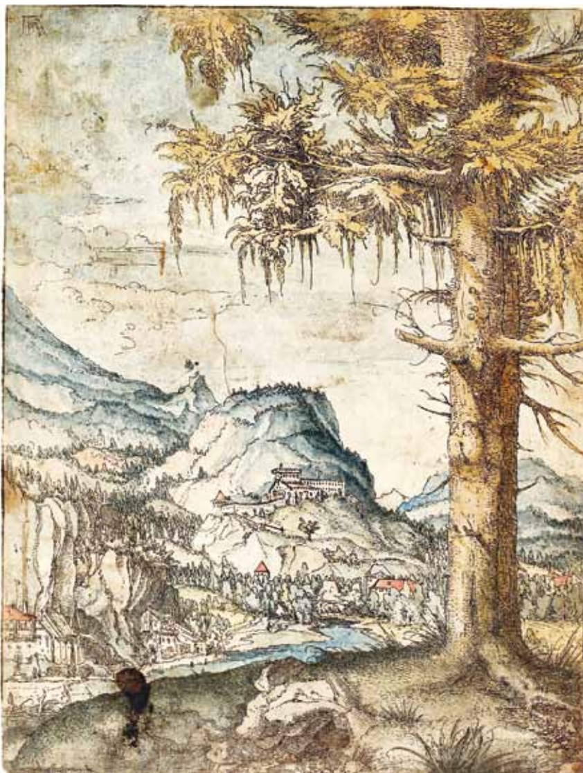
Albrecht Altdorfer (žil cca 1480–1538). Častým námětem slavného německého malíře a grafika je okolí Řezna. Krajina je často stylizovaná a fiktivní, v popředí je téměř vždy motiv jehličnanu. Ten je obtížné druhově určit, vzhledem k barevnosti může jít i o modřín.